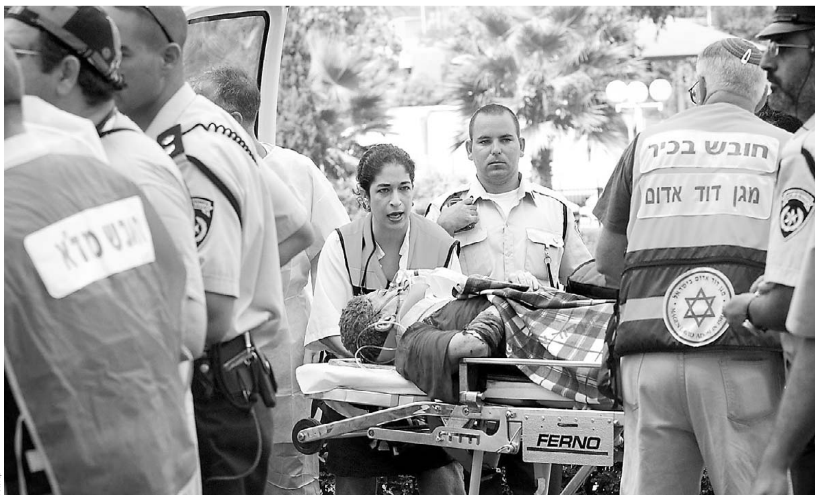
Auf dem Weg ins Hospital: Sanitäter bringen eine Verletzte zum Krankenwagen. Der Attentäter hatte seine Bombe vor einem Supermarkt gezündet.

Das tschechische Leistungsbilanzdefizit ist im Juni auf 11,1 Mrd. Kronen gesunken, im Mai lag es noch bei 19,3 Mrd. Kronen. Allerdings stieg das Minus in der Handelsbilanz laut Notenbank auf 3,3 Mrd. Kronen von zuvor 2,4 Mrd. Die ausländischen Direktinvestitionen sanken im Juni auf 10,9 Mrd. Kronen von zuvor 11,8 Mrd. vwd